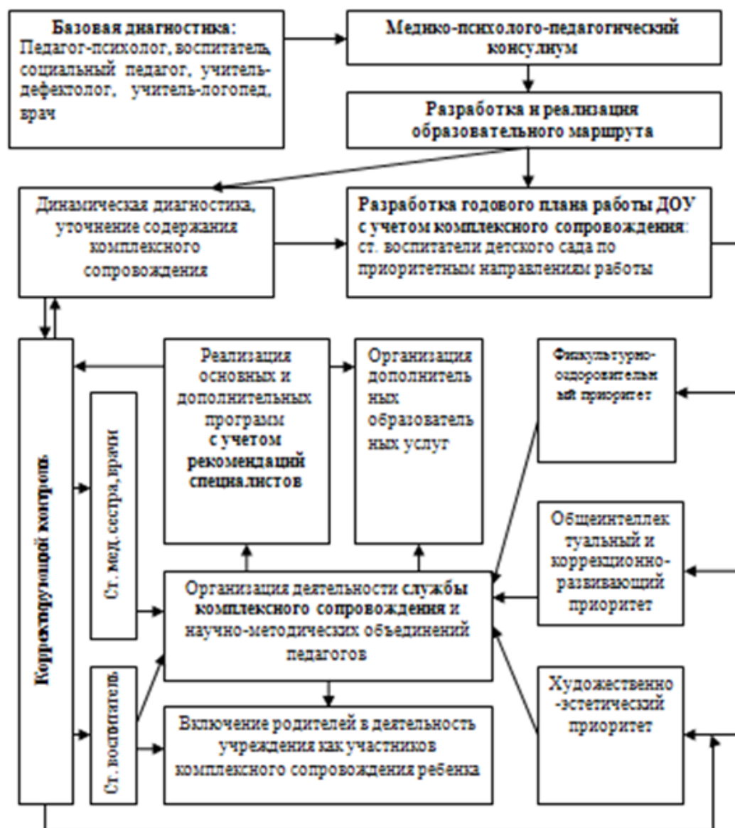
Схема взаимодействия специалистов

Работой по образовательной области « Речевое развитие » руководит учитель-логопед, а другие специалисты подключаются к работе и планируют образовательную деятельность в соответствии с рекомендациями учителя-логопеда.