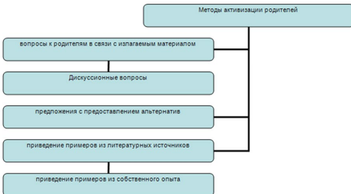
Схема. Методы активизации родителей

3 этап - формирование у родителей более полного образа ребенка и правильного его восприятия, включение родителей в образовательное пространство.