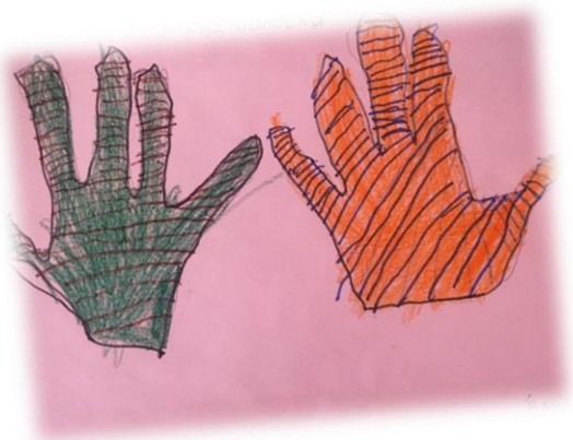
Липкие полоски (Ваня Т.)